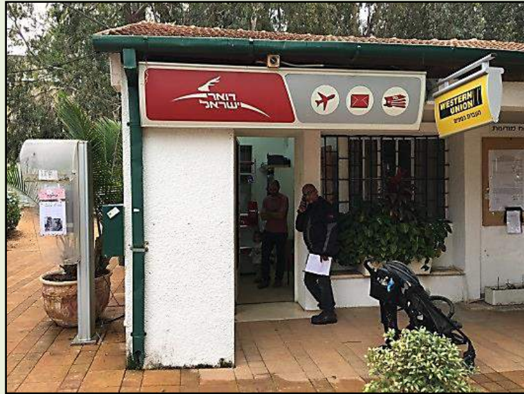
סניף הדואר כיום