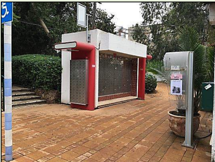
מרכז חלוקת הדואר