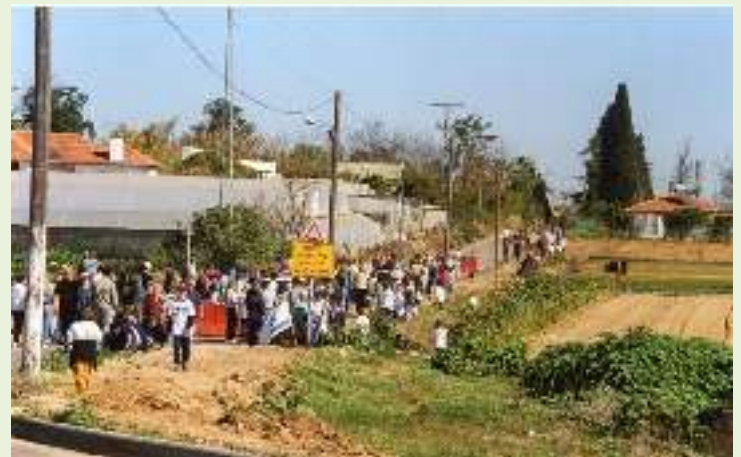
'השדרה' בדרך הסולטן 2014.