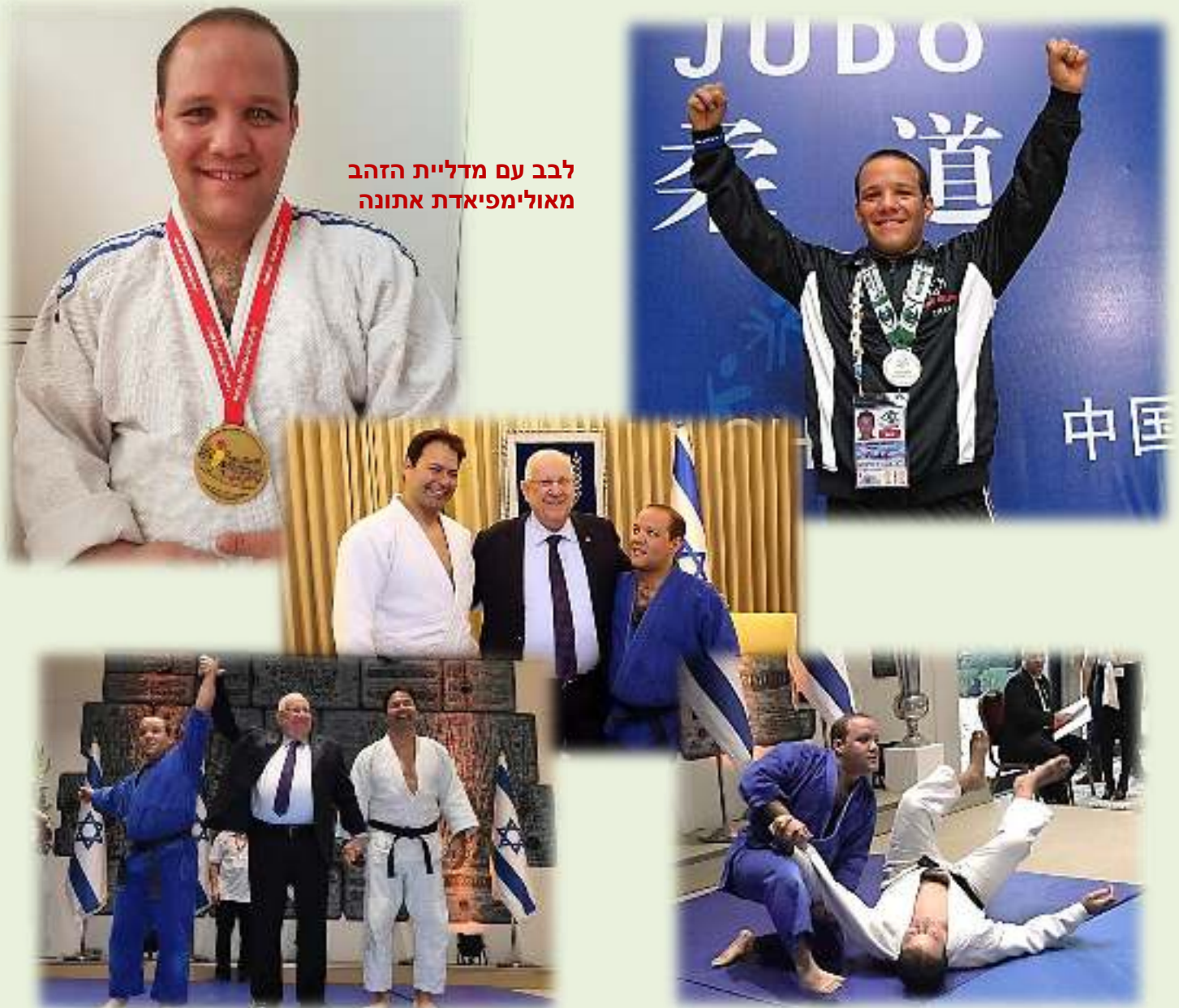
לבב עם מדליית הזהב מאולימפיאדת אתונה

בעל החשבון: העמותה לקידום ספורט משלב ע"ר (ספיישל אולימפיקס ישראל) מספר חשבון 0157184473 בנק דיסקונט סניף 118, נווה אביבים יהודה הנשיא 34, תל אביב