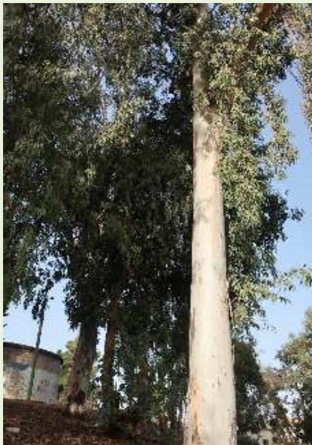
גן טריטש 2019.

עצי האקליפטוס שניטעו אז בגן הינם בני למעלה משמונים שנה, גדולים ומרשימים ועברו טיפול לשימורם בשנת 2015. בשנות ה-80 או ה-90 הורחב הגן בנטיעות נוספות. (מי זוכר או מי צילם?)