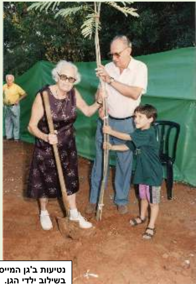
נטיעות ב'גן המייסדים' 1994, בשילוב ילדי הגן.