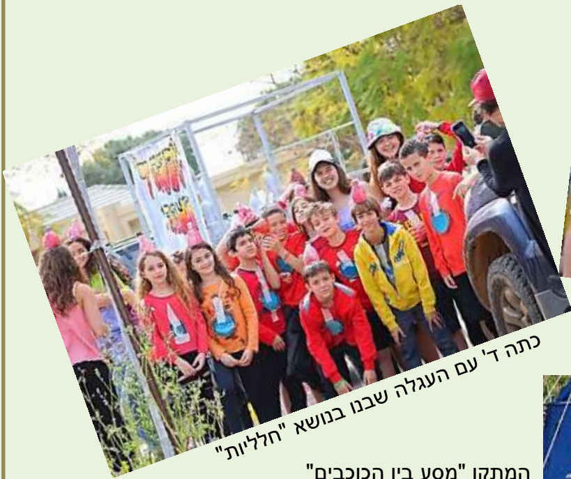
כתה ד' עם העגלה שבנו בנושא "חלליות"