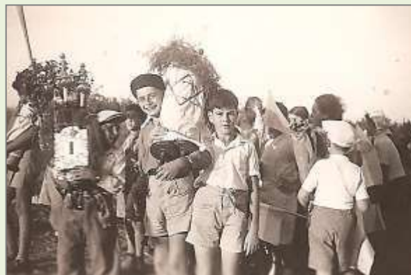
הכנסת ספרי תורה שהובאו מגרמניה בשנות השלושים