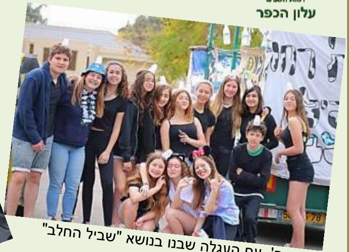
כתה ח' עם העגלה שבנו בנושא "שביל החלב"

המתקן "מסע בין הכוכבים" שבו שכב אחד הילדים בקובייה הוורודה והסתובב 360 מעלות