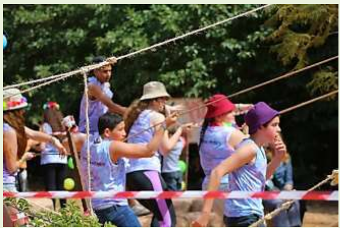
החברה עובדים קשה כדי לסובב את הקובייה