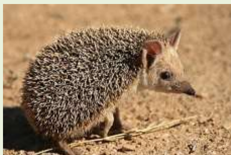
קיפוד חולות. שימו לב לרגלים הגבוהות ולאוזניים הגדולות.

הם מתרוצצים ביישוב בשעות הלילה, שקטים, שקטים בצעדיהם הקטנים הם עוברים מחצר לחצר בלילות ואפילו רכב האבטחה עם הציקלקה הירוקה לא יכול לעצור אותם. מי שעושה הליכות בלילה בוודאי כבר הבחין בהם... הקיפודים חזרו לפעילות.