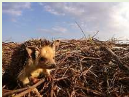
קיפוד חולות פעיל.

קיפוד חולות - Hemiechinus auritus – קיפוד קטן (130-360 גרם) וזריז מאד. אוזניו גדולות ורחבות. רגליו גבוהות וצלליתו גבוהה. קוציו סדורים ופרצופו פחוס יותר מזה של האירופאי. אפו מחודד.