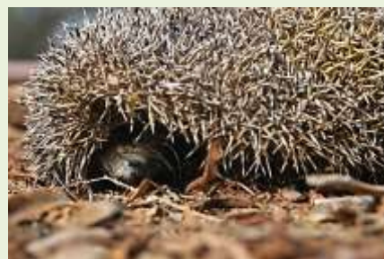
קיפוד אירופאי מצונף.

ואכן מאות קיפודים נדרסים מידי שנה בכבישי הארץ. ותופעה זו לא פוסחת על יישובנו. רק לשם ההמחשה ספרתי כ- 10 קיפודים דרוסים במשך שנה וזה רק מרחוב המייסדים.