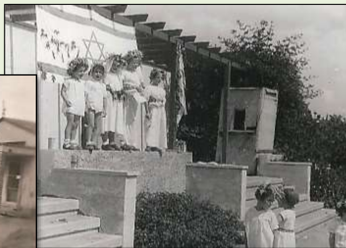
טקס הביכורים בחזית המזרחית של בית העם. [שנות ה-40?]

ואולם, חג הביכורים / השבועות אינו נזכר בחוזרים של ועדת תרבות בעשורים הראשונים וגם לא בחוזרים ובעלונים של בית הספר המקומי. בשיחות הטלפוניות שקוימו עם מספר תושבים שגדלו בכפר וגם גידלו בו את ילדיהם, התשובה הכמעט אחידה הייתה: 'בטוח שהחג קיים, אבל איני זוכר/ת פרטים'. אחדים הזכירו חג שהתקיים בנוסח המסורתי: החוגגים ישבו על חבילות שחת באבו קישק ונערים הופיעו רכובים על סוסים. לא הצלחנו לברר את השנה שבה התקיים הטקס הזה. הצילום הבא מעיד על קיום טקס הביכורים בשנת 1986, שלוש שנים לפני סגירת בית הספר המקומי.