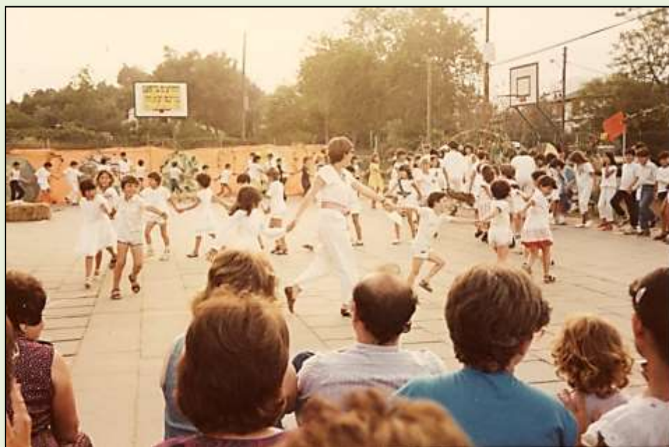
חגיגת הביכורים במגרש הספורט, במרכז מעגל ילדי כתה א'. 1986

המופע האחרון שבו קוים חג הביכורים בכפר ב-1993, זכור היטב. בשנה זו, שנת ה-60 לייסוד הכפר, פעל בית הספר המקומי המחודש במשך כשנה, שבמהלכה קוימו כל החגים בכפר ביוזמה והובלה של תלמידי בית הספר וצוותו ומסביבם כל תושבי הכפר. בשנה זו נאספו הטרקטורים והעגלות שעוד היו בידי התושבים, לכל כתה מ-א' עד ו' וגם לגן הילדים הוקצתה עגלה ולאחר תהלוכת העגלות התקיים הטקס במגרש הספורט. לצערנו לא נמצאו עדיין תמונות מאירוע זה.