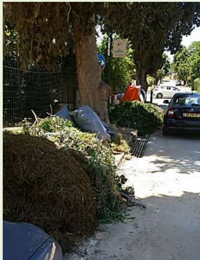
הברושים פינת הפקאן