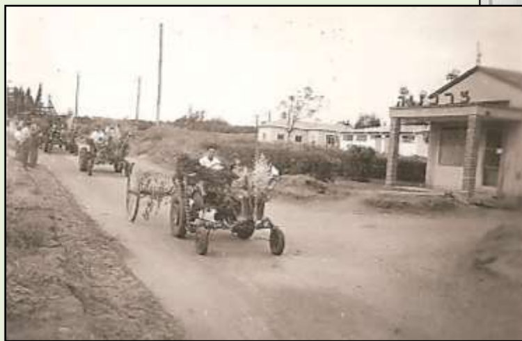
תהלוכת הביכורים, רחוב בית העם [שנות ה-50?]

בחיפוש אחר עקבות החג בכפרנו נמצאו רק עדויות בודדות, בעיקר צילומים אחדים המעידים שאכן התקיים בכפר טקס הבאת הביכורים, לפחות מדי פעם.