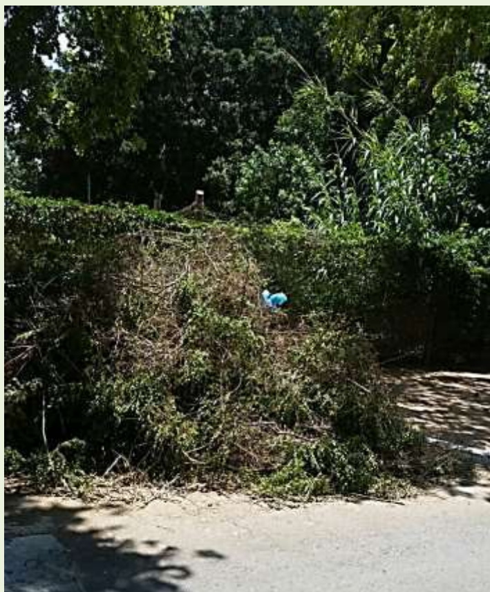
רחוב בית העם

ללא שיתוף פעולה של התושבים לא נצליח להתגבר על ערמות הגזם בכפר אנו מבקשים את שיתוף הפעולה שלכם למען כפר נקי ונעים לכולם !!