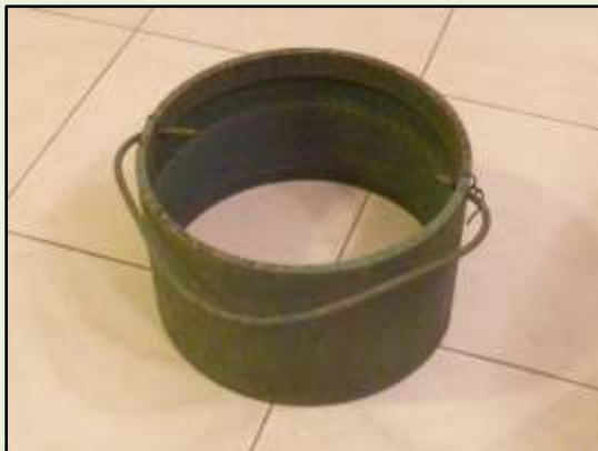
פעמון אזעקה - מאוסף החפצים של הארכיון 2016

(2) איסוף וטיפול בצילומים - גם במשימה זאת נמשכת עבודת האיסוף, הסריקה, המיון והקטלוג של הצילומים. אוסף הצילומים של הארכיון כולל צילומים מקוריים, שנאספו בידי הוועד בעבר או נמסרו לארכיון בידי התושבים, וכן צילומים שסרקנו מתושבי הכפר. חשיבות הצילומים לתיעוד נאמן ואמיתי של זמנם, בין שמדובר בעבר הרחוק ובין שמדובר בהווה - חשובה ביותר! על מנת לשמר באופן המיטבי את הצילומים, הסרטים, הקלטות ושאר הפורמטים הישנים, נעשתה פעולת המרה שלהם לפורמט העכשווי, ואלה מרוכזים כעת בהחסן וניתנים לצפייה במחשב (למשל, סרט שהופק לחג העשרים של הכפר, בפילם 16 מ"מ).