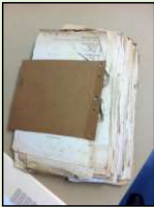
תיק מסמכים מחכה לטיפול