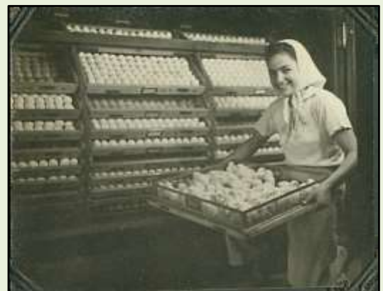
המדגרה, סוף שנות ה-30

(3) איסוף חפצים 'היסטוריים' - חפצים שהיו בשימוש בעבר, וממחישים את אורח החיים שהיה נהוג בכפר, חשובים להשלמת המשימה של הארכיון לשמר את העבר ולהנגישו בהווה. בנוסף לאיסוף החפצים שהתושבים תורמים, צוות הארכיון משתדל להגיע למידע רב ככל האפשר אודות כל פריט, בין שמדובר במכונת תפירה של חברת Singer המהוללת, או בחנוכייה רבת שנים, חשוב הסיפור שמאחורי החפץ. מסיבה זו לעיתים ממלא צילום החפץ, שבעליו עדיין לא רוצה להיפרד ממנו, את מקום החפץ עצמו.