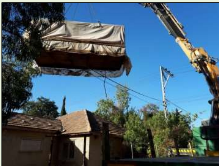
ה'ליפט' בין שמים וארץ 26.10.2017