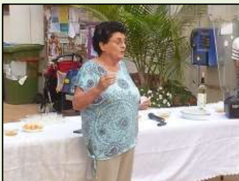
טקס פתיחת התערוכה