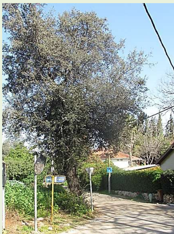
עץ האלון בפינת סימטת מג"ן צילום: דב זהר, 2015

עצי האלון המפוזרים בכפר בשטחים הציבוריים או בחצרות הפרטיות הינם שריד מיער האלונים העתיק שהשתרע באזור השרון. עדויות לקיומו של היער מופיעות כבר בתקופת המקרא, 1 ובהמשך בתקופת הצלבנים. הנוסע הצרפתי וולני כתב ב-1787: "בארץ קיסריה נמצא יער האלונים הגדול והנהדר במערב ארץ ישראל [...]". במפות ששורטטו בפקודת נפוליון בשנת 1799 מצוין יער צפוף בדרום השרון, מאזור רמת הכובש ועד אזור רמתיים של היום. 2 בסקר שערכה החברה הבריטית לחקר ארץ ישראל באזורנו בשנים 1871-1878 מצוין יער גדול ומשמעותי במרכז השרון ובדרומו.