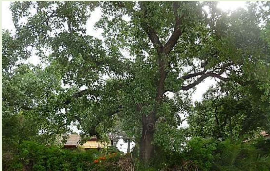
עץ האלון בחצר משפחת שטיינהרדט, רחוב האלונים. צילום: גונן ישר, 2016

מרבית היער שהיה יער אלונים תבור, נכרת בראשית המאה ה-20 בתקופת מלחמת העולם הראשונה ע"י העות'ומנים – לצורכיהם. עם השנים ופיתוח ההתיישבות באזור הלך היער ונעלם, באזורנו נותרו ממנו פרטים בודדים בלבד, כמו למשל ברחוב האלונים, ברחוב שרת ובסוף רחוב הלימון, פרטים המפוזרים בחצרות הפרטיות וכמובן עץ האלון שנגדע בכניסה לסמטת מג"ן.