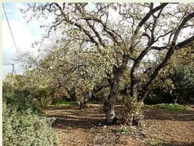
חורשת האלונים ברחוב הלימון צילום: איריס מורג, ינואר 2018

שמירת עצים בטבע ובמרחב הציבורי הינה סוגיה המעוגנת היטב בחוק. על פי תיקון 89 לחוק התכנון והבניה, כל העצים הבוגרים (המוגדרים על פי רשימה), מוגנים על פי חוק. כל פרויקט בינוי שבתחומו עצים מחייב חוות דעת מקצועית של פקיד היערות. כריתה או השחתה של עץ ללא היתר, על פי תיקון זה, מהווה עבירה פלילית. על פי התיקון לחוק, נקבע כי עבור כל תכנית בנייה שניתן להוציא