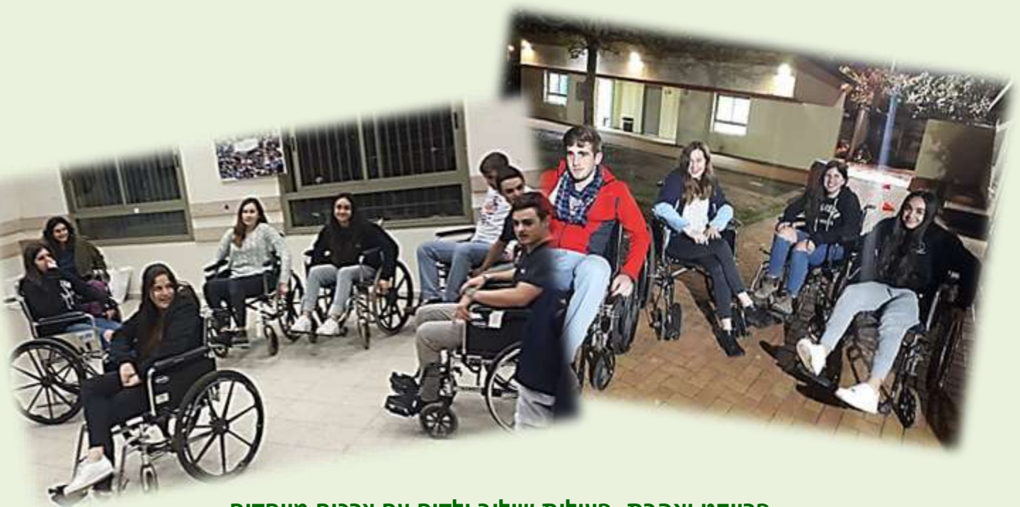
פרויקט ואהבת- פעילות שילוב ילדים עם צרכים מיוחדים

חניכי הלול עברו בחודש האחרון פעולות בנושא "אחריות קהילתית" כאשר כל פעולה עסקה בסוגים שונים של קהילות, החל מהיישוב, דרך תנועת הנוער ועד קהילת אזרחי ישראל. פעולת הסיום תעסוק בתרומה לקהילה, במסגרתה יגייסו הילדים כספים בדרכים שונות (מכירת עוגות, רחיצת מכוניות וכדומה) ואת התמורה יתרמו לנזקקים בחברה הישראלית.