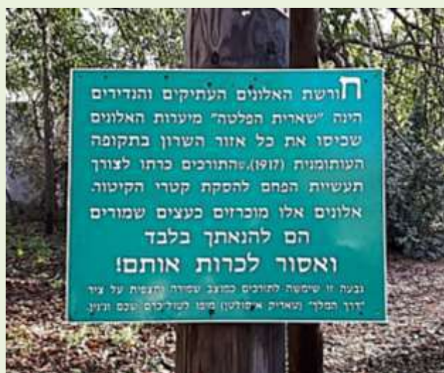
שלט השימור של חורשת האלונים צילום: איריס מורג, 2018