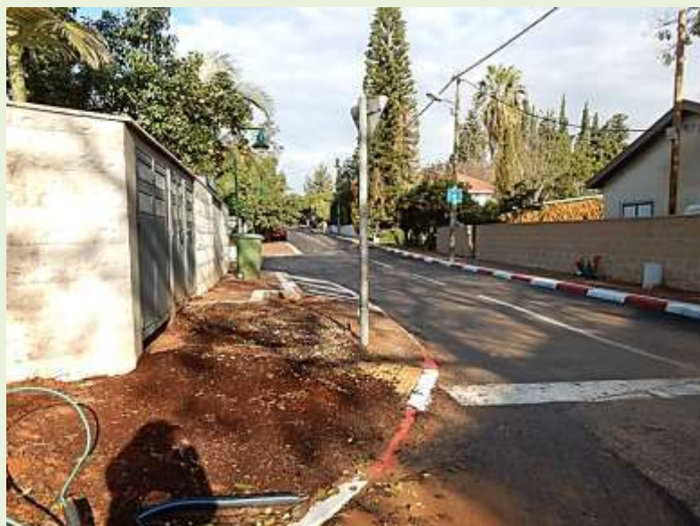
פינת סמטת מג"ן ללא עץ האלון ינואר 2018

כל העובר על פני מפגש הרחובות סמטת מג"ן ורח' השקד, ודאי שם לב לפעולות הפיתוח והרחבת הכביש של סמטת מג"ן. בפינת הרחוב מצד שמאל עמד עץ עלון ותיק, אך סופו שנפגע עקב פעולות הפיתוח של הקבלן או חברת בזק שעבדו במקום, שורשיו נחתכו, העץ מת ונכרת.