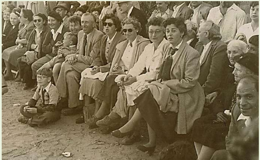
יום העצמאות, 1953

מעקב אחר האופנה ברמות השבים מצביע על שילוב בין פרטי לבוש שהובאו מגרמניה עם המתיישבים, בד"כ בגדים 'עירוניים' וחגיגיים הנראים אלגנטיים בהשוואה לחיי הכפר שהועידו לעצמם, לצד בגדי עבודה כפריים אך מסוגננים. הדור הצעיר ההופך לנוער ולמתבגר, מייצג יותר מכל את שינוי הרגלי הלבוש בקרב העולים ואת התאקלמות האופנה המקומית בקרב המתיישבים.