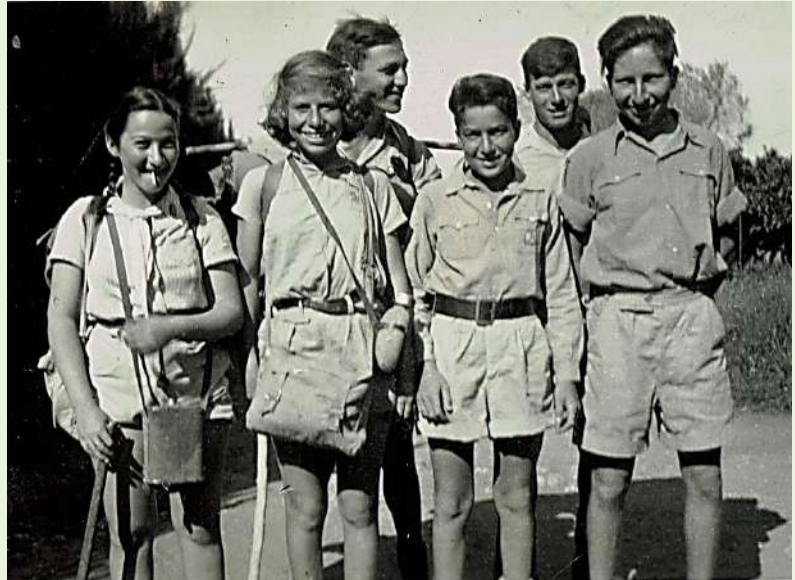
טיול המחנות העולים לגליל, פסח 1947

החליפות החנוטות מאירופה הוחלפו בבגדים המותאמים יותר לאקלים החם בארץ: מכנסיים קצרים או חצאיות לנשים, לרוב בייצורה של חברת אתא המיתולוגית, עם חולצה לבנה תפוחת שרוולים לבנות!