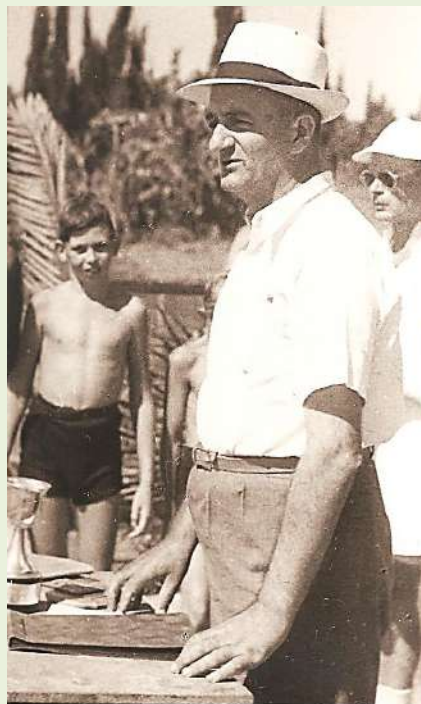
מנהיים בעמדת הנואם בחנוכת צריף אהוד רמות השבים, שנות ה-40

בתערוכת החוצות החדשה בכפר, שתיפתח ב- 14.9.2018 רצינו להציץ לחדר הארונות של המתישבים הראשונים, להביט על הבגדים האירופאיים שהביאו עמם והמעבר האופנתי לזהות מקומית ישראלית.