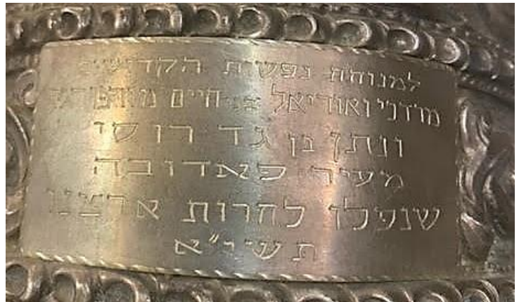
לוחית ההנצחה שהוצמדה על הכתר