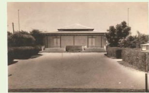
75 לבית העם