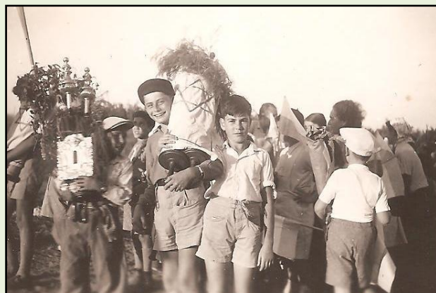
טקס הכנסת ספרי תורה, שהביאו המתישבים מגרמניה

למרות כל האמור עד עתה, נראה שמתחילת תכנון בית העם, נכלל בו גם מתחם תפילה. תופעת המיזוג בין היכל תרבות חילוני לבין מתחם תפילה דתי, הייתה ייחודית לבתי העם ביישובים הכפריים של עולי גרמניה (כמו למשל בגן השומרון, כפר שמריהו, שדה ורבורג ובית יצחק). המיזוג הזה היה תוצאה של מספר גורמי השפעה. ביישובים אלה היה הקשר לדת רופף או סמלי בלבד, היה זה גם פתרון חסכוני במציאות של מחסור במשאבים, אך החשובה מכולם הייתה רמת הסובלנות הגבוהה וראיית הדת כאחת הפנים התרבותיות והחברתיות של היישוב. כל הגורמים הללו היו תקפים גם בכפרנו, ועל כן בתכנון ובבנייה של בית העם הוקצה מיוחד לבית התפילה ובישיבת ועד ומועצה, ב-22 בנובמבר 1939, סמוך לחנוכת הבית, אושרה 'בקשת הקהילה להקים ארון תורה על חשבון הוועד'. בארון הונחו ספרי התורה ופריטים אחרים שהביאו עמם המתישבים הדתיים מגרמניה. באירועים חילוניים כוסה הארון בוילון שנרכש במיוחד למטרה זו. בבית הכנסת לא יוחד מקום ליעזרת הנשים' וההפרדה בין גברים לנשים הייתה סמלית בלבד.