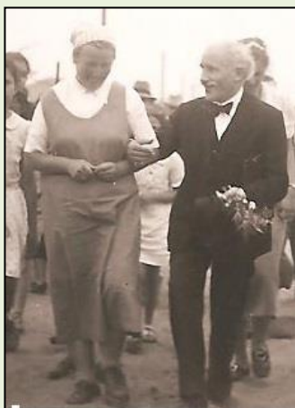
טוסקיני ודוקטור שטקלמכר?

לפני זמן קצר ציינו את סיום שנת ה-75 לבית העם בערב מוסיקלי יפה ומרגש. תודתנו נתונה לכל מי שטרחו ועמלו למימוש המאורע ועשו זאת בהצלחה רבה. ראוי לתודה מיוחדת המנצח, מיכאל שני, שהשכיל לשלב בחן רב, בין עולם המוסיקה לבין עולמה של רמות השבים בעשורים הראשונים לקיומה.