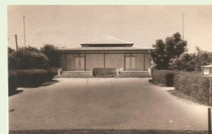
75 לבית העם