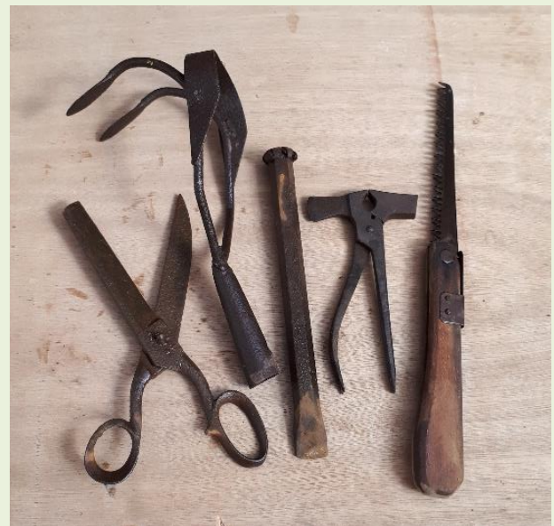
כלים שנתרמו ע"י משפחת אביסדריס מבית הימן גינצבורג