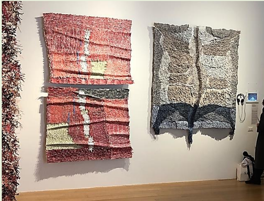
עבודות על קיר הביאנלה בוונציה, 2019.

כדאי לבקר בביאנלה 2020 המקיפה השנה יוצרים מתחומים שונים כמו קרמיקה, נייר, טקסטיל, זכוכית ועוד, והיא פרושה על פני כל המוזיאון. התערוכה תוכננה להיות מוצגת עד אוקטובר, אך כרגע היא ללא מועד סיום.