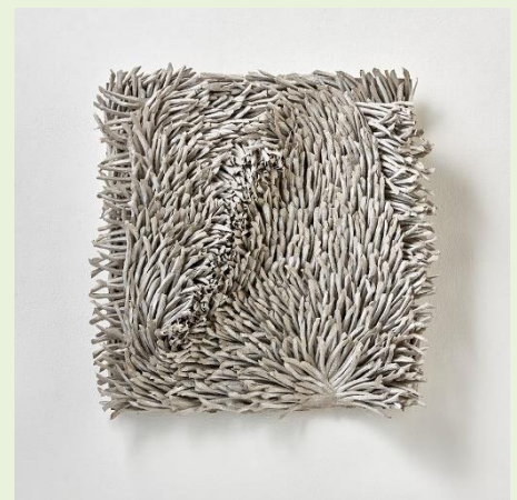
עבודות מתוך הסדרה "קצב ותנועה", 2018.

במהלך יצירת העבודה קורעת ביאנקה את הנייר בעדינות לפיסות נייר קטנות ויוצרת שכבות המורכבות מפיסות בגדלים וצורות שונים, בעלות טקסטורה חדשה ומקורית. בתהליך הקריעה מסירה ביאנקה את רכות הנייר ויוצרת חספוס ייחודי המכיל חוויות, אהבות, מסעות, מחשבות, אובדן ושמחה. טכניקת הקריעה מהווה מדיום אמנותי בפני עצמו כמטאפורה להיקרעות מכל הקשרים החברתיים והחפצים האישיים, חוויה שאותה חשה בעצמה עם חזרת המשפחה לישראל, עקירה שהיא מצד אחד כואבת ומן הצד השני "יש בעקירה מהשורשים מן האופטימיות והיא אף מהווה הזדמנות לצמיחה".